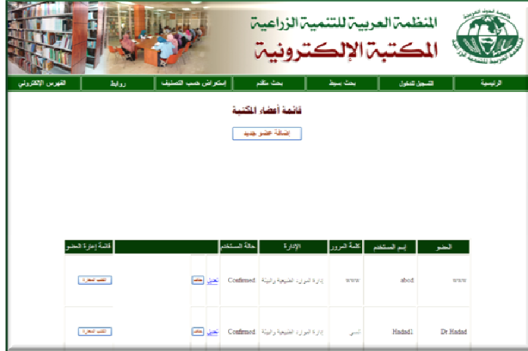
شكل (3) نموذج استعراض بيانات الأعضاء والتأكد منها وإعطائها الصلاحية